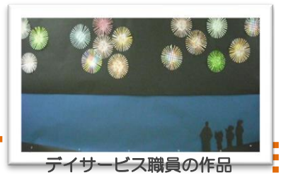
デイサービス職員の作品