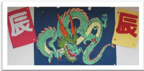
利用者様作品 「辰年」