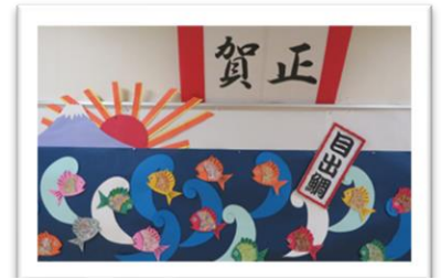
お正月壁画 「おめで鯛！」