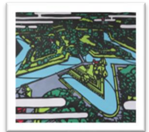
デイサービス職員の作品