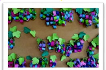
♣折り紙アート ブドウの実

◆ 昼食メニュー ◆ けんちんうどん・なすのみそ炒め・いんげんのクルミ和え バナナ 〈おやつ〉 パパロア