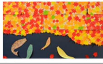
♣見事なちぎり絵 紅葉と鯉