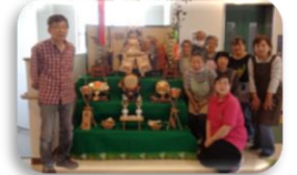
園芸ボランティアの皆様