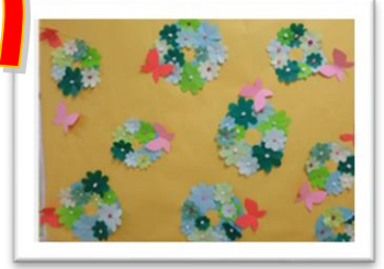
ご利用者様作品 「春の装い」