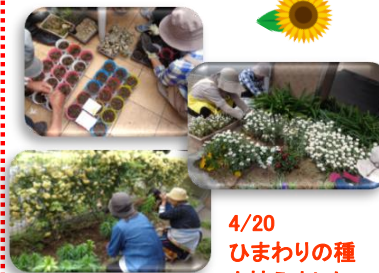
4/20 ひまわりの種を植えました!