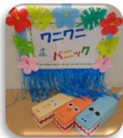
ワニワニパニックイメージ