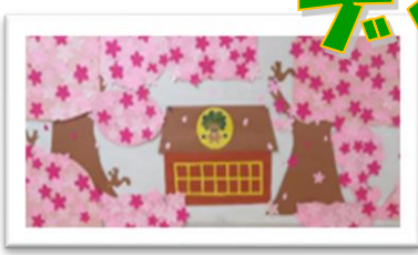
ご利用者様作品 「桜の風景」