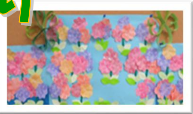
ご利用者様作品 「可愛い花たち」