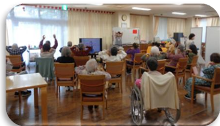
♥みんなで一緒にテレビ体操をします