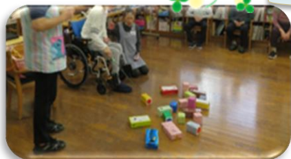
★狙いを定めて「牛乳パック釣り」