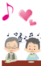
♪4/16のアンサンブルひまわり様の演奏会