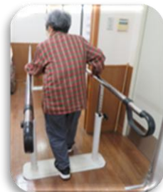
♠平行棒で歩行訓練をします