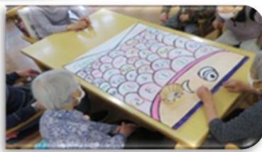
♣年1度の出番です「こいのさやあて」